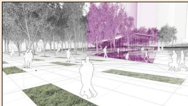
Le concept choisi est celui des firmes Lemay, Angela Silver et SNC-Lavalin. Photo : Ville de Montréal/Lemay + Angela Silver + SNC-Lavalin

« Bravo à l'équipe gagnante qui nous propose un magnifique lieu public pour se reposer, se promener, se rassembler et admirer le cœur de notre ville tout en honorant la mémoire de très grandes Montréalaises », a déclaré Mme Plante, visiblement enchantée par le projet.